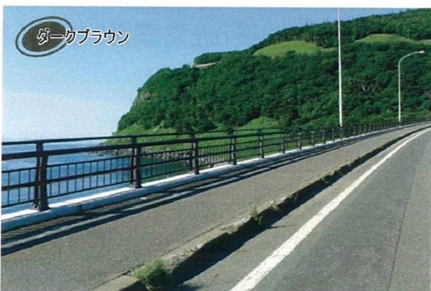
種別A 高欄兼用車両防護柵 2本レールタイプ