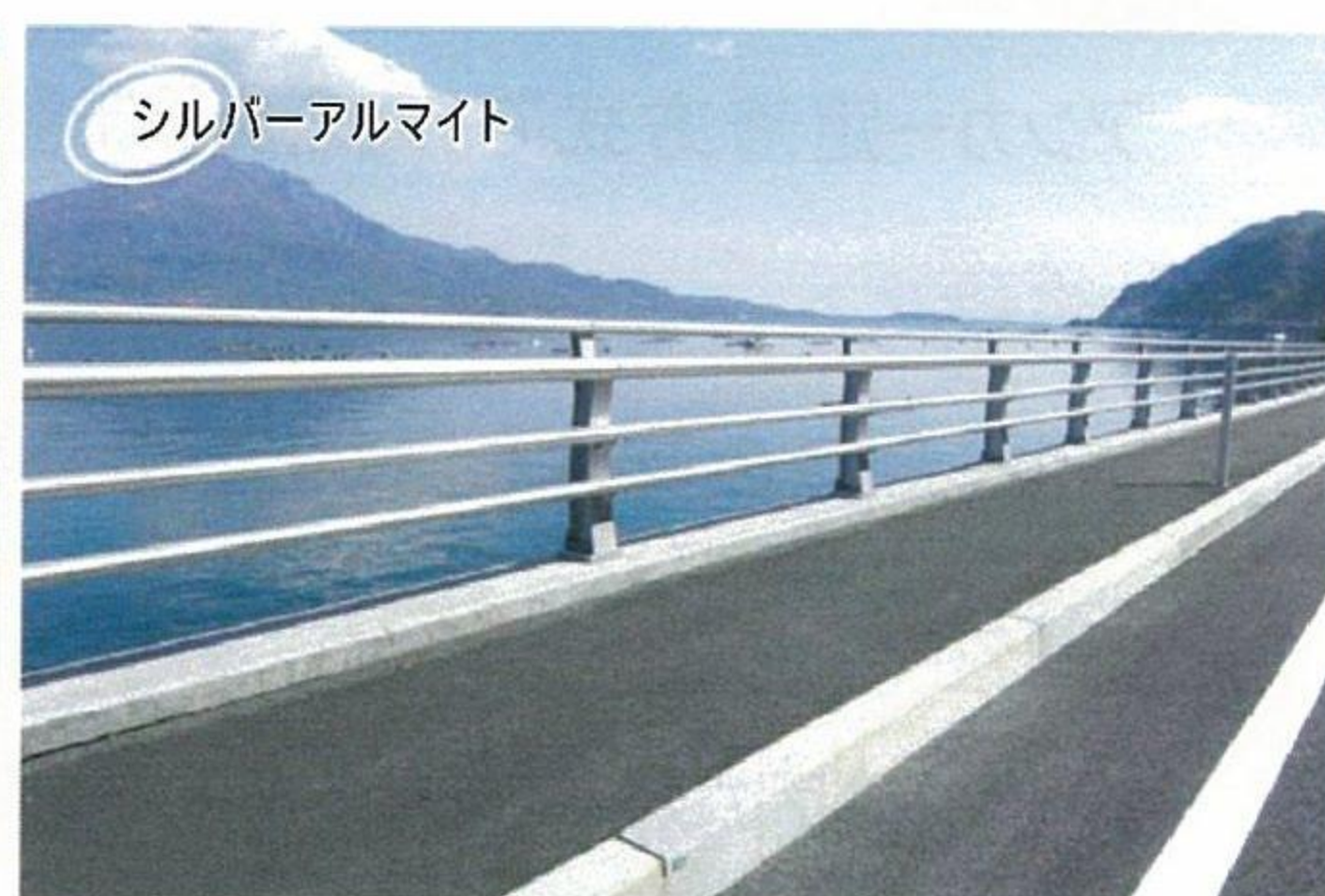
種別A 高欄兼用車両防護柵 3本レールタイプ