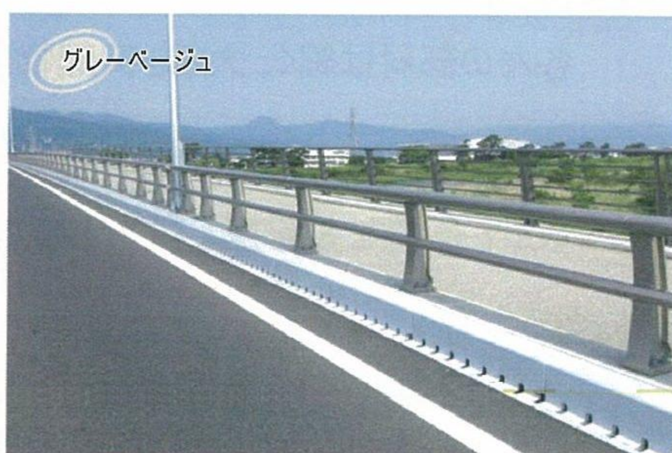
種別A 車両用防護柵 2本レールタイプ