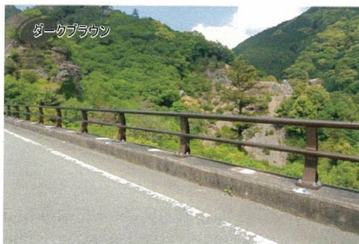
種別B 車両用防護柵 2本レールタイプ