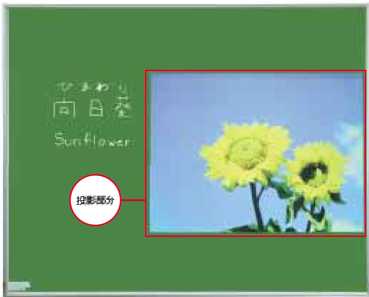
映せる黒板 美映え(びばえ:品番B-524-CMM)

You can project, write with chalk and erase it with ease. new type chalkboard with multi-function Chalk Projection Board.